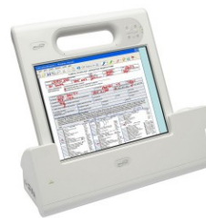
>> Motion Computing C5